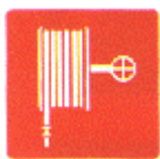
Manguera para incendios

Forma rectangular o cuadrada. Pictograma blanco sobre fondo rojo.