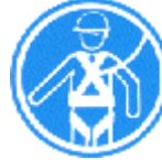
Protección individual obligatoria contra caídas