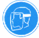
Protección obligatoria de la cara