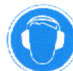
Protección obligatoria del oído