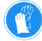
Protección obligatoria de las manos