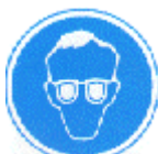
Protección obligatoria de la vista

Obligan a un comportamiento determinado. Forma redonda. Pictograma blanco sobre fondo azul (el azul deberá cubrir como mínimo el 50% de la superficie de la señal).