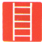
Escalera de mano