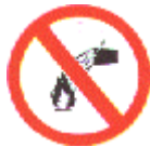
Prohibido apagar con agua