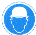
Protección obligatoria de la cabeza