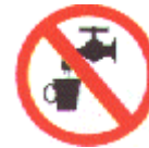
Agua no potable