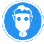
Protección obligatoria de las vías respiratorias