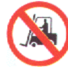
Prohibido a los vehículos de manutención