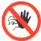
Entrada prohibida a personas no autorizadas