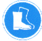
Protección obligatoria de los pies