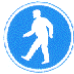
Vía obligatoria para peatones