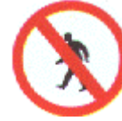
Prohibido pasar a los peatones