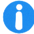
Obligación general (acompañada, si procede, de una señal adicional)