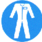
Protección obligatoria del cuerpo