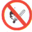
Prohibido fumar y encender fuego